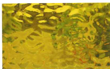
EM4916A ミディアムアンバー