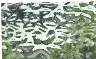
EM4903A ペールブルー/グリーン